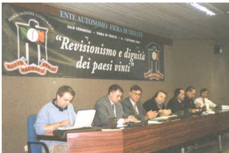
Il tavolo degli oratori in un momento della conferenza.

Questa scuola di pensiero considera la nostra situazione attuale come una guerra a livello mondiale su fronti invisibili. A suo giudizio, la disfatta militare tedesca nel 1945 ha lasciato i popoli europei e il resto del mondo indifesi di fronte alle forze militari