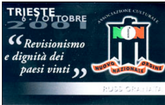
Targhetta di riconoscimento degli oratori ufficiali.

essa come quelli dell' 11 settembre, smetterebbe di fare le cose che li hanno provocati!